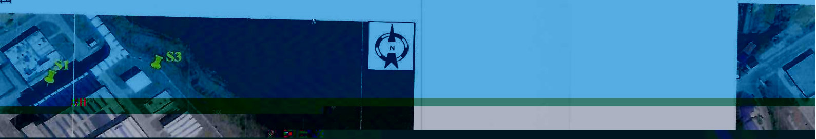
(一) 监测点位示意图